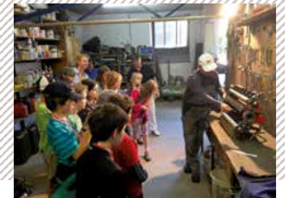
Oben: Die lokale Presse ist stets involviert Links: Hausaufgaben machen auf dem Golfplatz Rechts: Frühe Einblicke in die Technik

3 CLUB: Golfclub Hof e.V. Gumpertsreuth 25 | 95185 Gattendorf-Haidt Tel.: 0 92 81 . 470 155 | Fax 0 92 81 . 470 157 E-Mail: golfclub-hof@t-online.de Internet: www.gc-hof.de