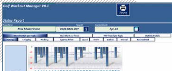
Ausschnitte aus der neuen Trainings-Software des GC Herzogenaaurach

CLUB: Golf Club Höslwang im Chiemgau e.V. Kronberg 4 | 83129 Höslwang Tel.: 0 80 75 . 7 14 | Fax: 0 80 75 . 81 34 E-Mail: info@golfclub-hoeslwang.de Internet: www.golfclub-hoeslwang.de